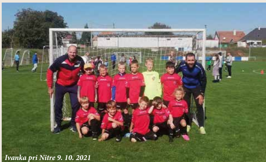
Ivanka pri Nitre 9. 10. 2021