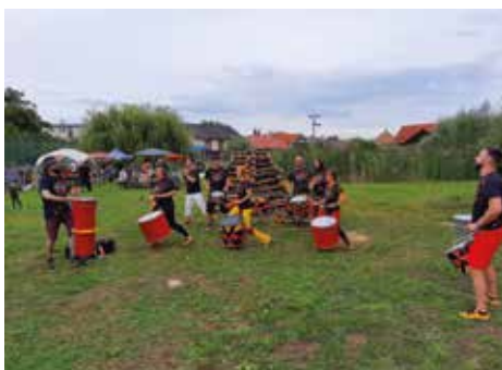
Rozlúčka s letom

ha prečerpávanie odpadovej vody z prvého do druhého reaktora a po odčerpaní splaškov bude našimi pracovníkmi vyčistený priestor prvého reaktora tak, aby mohol byť zmapovaný skutkový stav a zadaný presný rozsah generálnej opravy na účely procesu verejného obstarávania. V spojitosti s týmito krokmi obec zároveň podala na Environmentálny fond žiadosť na roz-