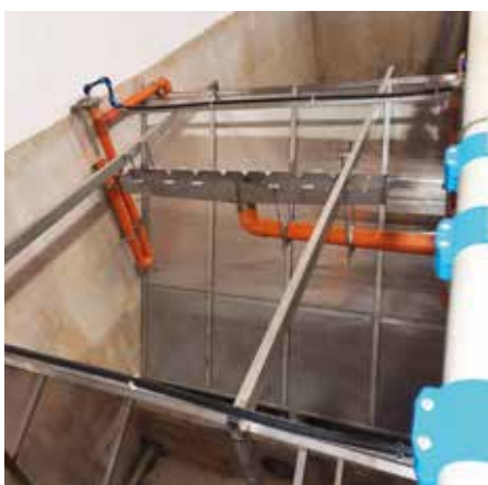
ČOV 2. reaktor