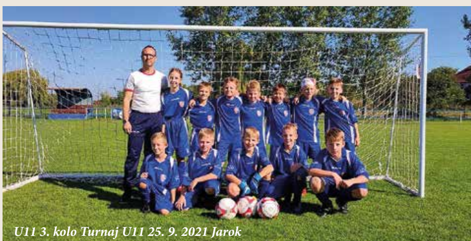
U11 3. kolo Turnaj U11 25. 9. 2021 Jarok