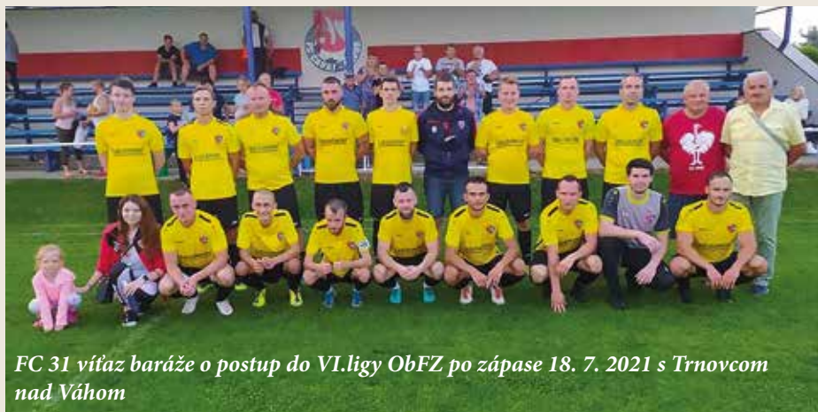
FC 31 víťaz baráže o postup do VI.ligy ObFZ po zápase 18. 7. 2021 s Trnovcom nad Váhom

Mužstvo mužov je, ako nováčik súťaže v 6. lige ObFZ Nitra po odohratí jej štrnástich kôl jesennej časti, priebežne na deviatom mieste s bilanciou 6-krát víťazstvo, 1-krát