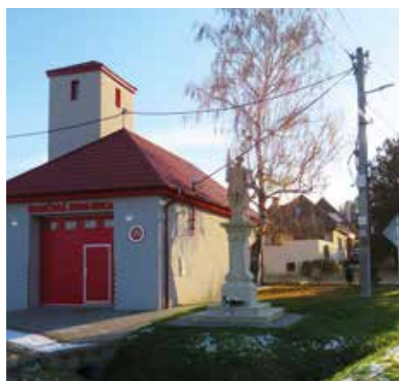
Zreštaurovaná socha sv. Floriána

V auguste bola slávnostne vysvätená zreštaurovaná baroková socha sv. Floriána pred hasičskou zbrojnicou, ktorá je prvou