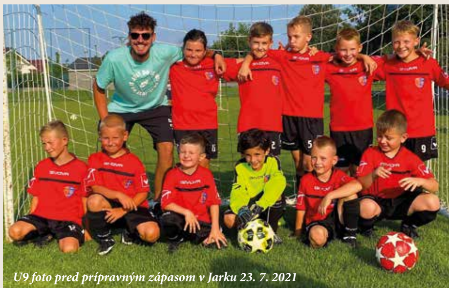
U9 foto pred prípravným zápasom v Jarku 23. 7. 2021