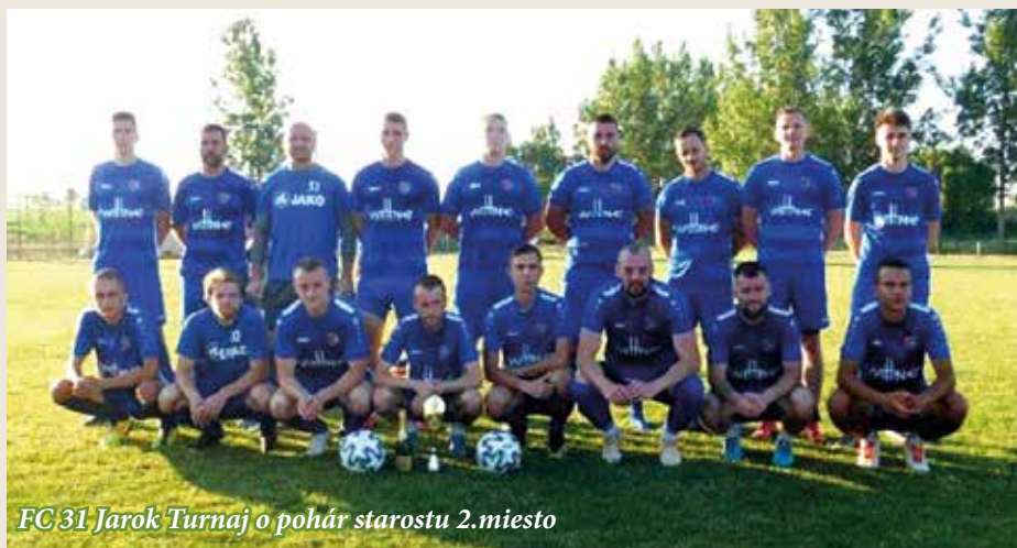
FC 31 Jarok Turnaj o pohár starostu 2.miesto