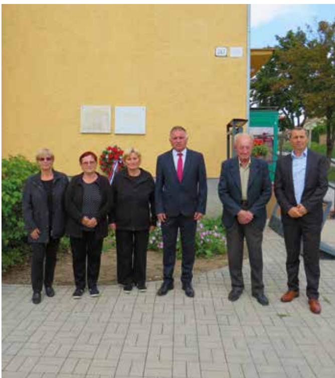
Spomienka na padlých spoluobčanov v II. sv. vojne pri príležitosti 77. výročia SNP