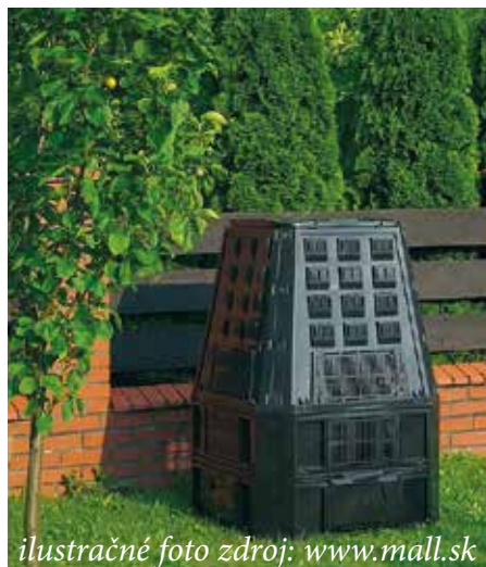
ilustračné foto zdroj: www.mall.sk

povinností vyčlenila v rozpočte sumu takmer 24 tisíc eur a zabezpečila možnosť kompostovať kuchynský odpad pre všetky domácnosti prostredníctvom centrálne ob-