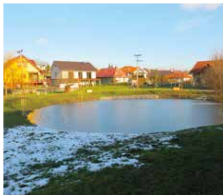
Jazierko na Šarine

V blízkosti Poľovníckeho domu sme z dotácie z programu „Obnova dediny“ vo výške 5 000,- eur dotvorili areál Na šarine. Bolo vybagrované jazierko, spevnené okraje jazierka kameňom, vysadené vrby, osadené lavičky a vysadená tráva. Predmetnú lokalitu si vezme pod patronát Poľovnícka spoločnosť tak, aby táto novovybudovaná oddychová zóna v obci mohla dlhodobo a zmysluplne slúžiť všetkým občanom a návštevníkom našej obce.