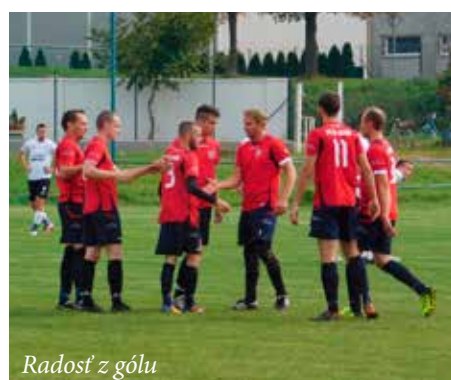
Radosť z gólu