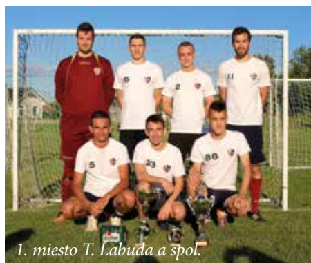
1. miesto T. Labuda a spol.

Po skončení uvedeného súťažného ročníka 2017/2018 sme v spolupráci s obcou Jarok pripravili ďalší ročník tradičného turnaja v minifutbale o Pohár starostu obce, ktorý sa uskutočnil 30. júna 2018. Pre návštevníkov turnaja a hráčov bola pripravená bohatá tombola, občerstvenie a na záver i neformálna disko zábava.