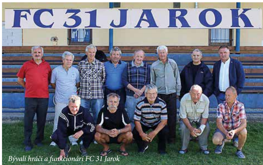
Bývalí hráči a funkcionári FC 31 Jarok