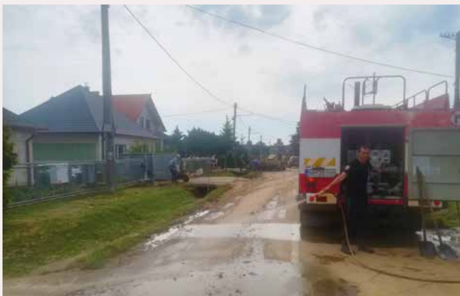
Odstraňovanie povodňovej situácie