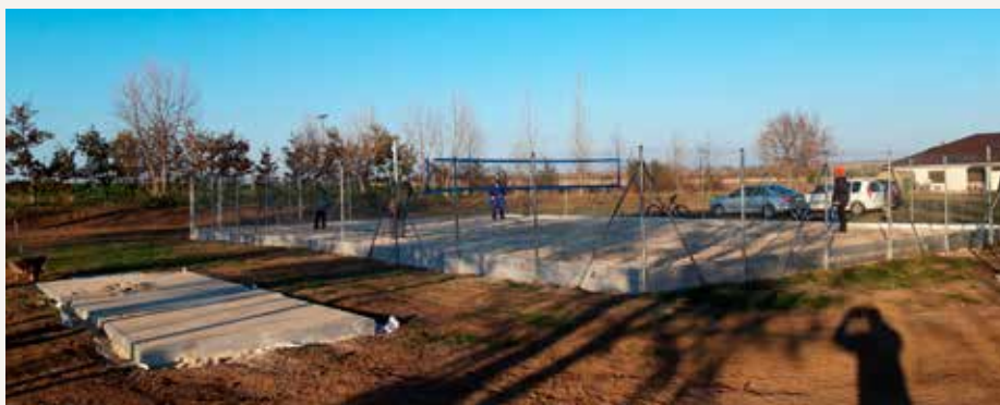
Novovybudované pieskové doskočisko a ihrisko na plážový volejbal v severnej časti areálu Základnej školy v Jarku.