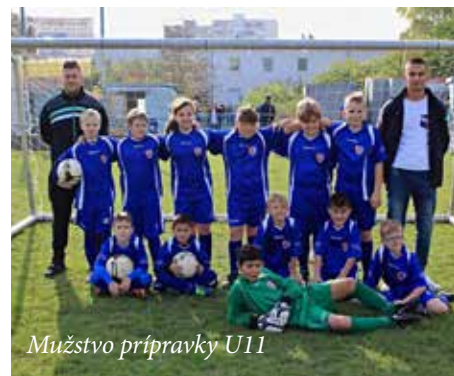
Mužstvo prípravky U11