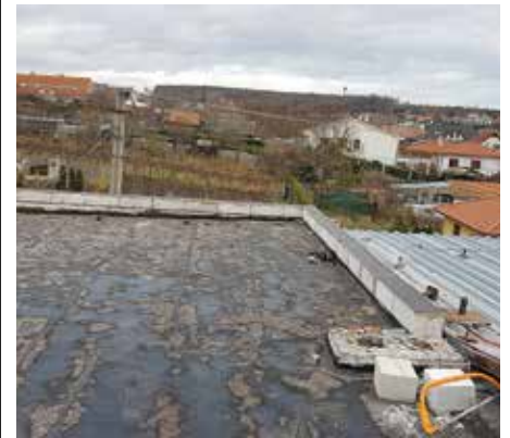
Havarijný stav strechy nad stomatologickou ambulanciou

Začiatkom decembra nám bolo oznámené, že nám začalo zatekať do stomatologickej ambulancie. Po preverení skutočného stavu sme skonštatovali, že sa jedná o havarijný stav, a preto sme pristúpili k rekonštrukcii. Celá zadná časť strechy KD bude zateplená a prekrytá novou krytinou.