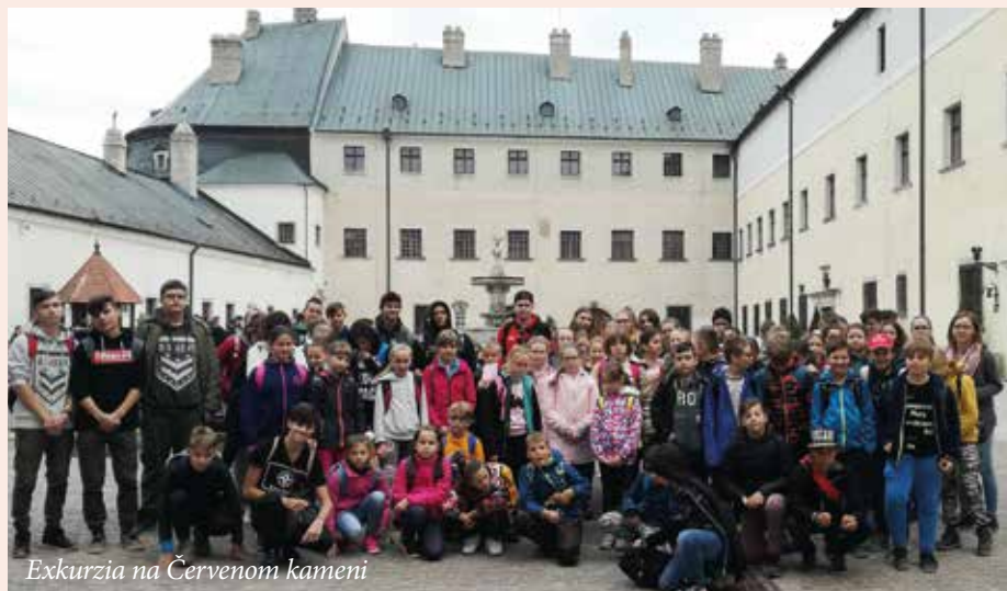
Exkurzia na Červenom kameni