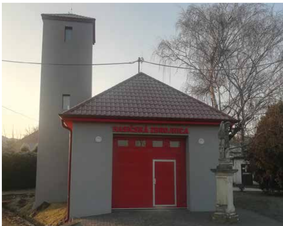
Kompletne zrekonštruovaná Hasičská zbrojnica

Podarilo sa nám osadiť nové dopravné značky, čím sme vyselektovali nákladné autá z obce. Dúfam, že vodiči nákladných automobilov budú tieto dopravné značenia rešpektovať a budú využívať parkovisko za kostolom, alebo budú parkovať na vyhradených miestach. Novovybudovaný chodník na Hlavnej ulici sme dali zamerať a následne bol úspešne skolaudovaný.