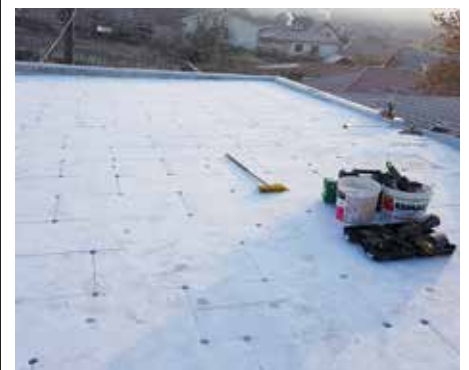
Rekonštrukcia zadnej časti strechy kultúrneho domu

Na záver mi vážení občania dovoľte, aby som Vám zaželel príjemné prežitie vianočných sviatkov v kruhu svojich najbližších a aby rok 2019 bol pre Vás krajší a úspešnejší, ako ten predošlý.