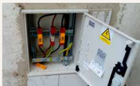
Elektrické rozvádzače na kuchyni a telocvični základnej školy, stav pred a po ich kompletnej rekonštrukcii.

Tolko k bilancovaniu za posledné obdobie tohto roku a môžeme prejsť k celkovému bilancovaniu projektov a prác, ktoré sme mali možnosť zrealizovať za aktuálne sa končiace štvorročné volebné obdobie. Pred samotným výpočtom prác a projektov však chcem poznamenať, že takto obširný zoznam nie je výsledkom toho, že by sa obec vo svojej práci špeciálne zameriavala len na základnú a materskú školu, ale predovšetkým toho, že sa tejto oblasti nikto v minulosti systematicky, dlhodobo a strategicky nevenoval. Treba si uvedomiť, že práve kvalitná základná a materská škola je predpokladom dobrého a udržateľného rozvoja obce a predovšetkým výchovy uvedomelých, vzdelaných a rozhladených občanov,