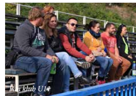
Fot. klub U11