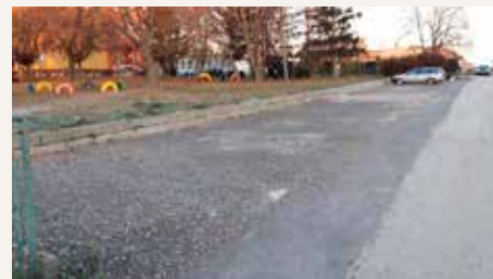
Rozšírené parkovisko pri vstupe do areálu Základnej a materskej školy v Jarku