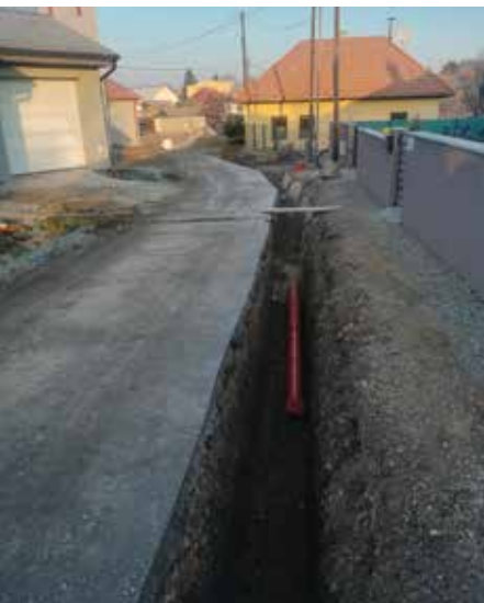
Práce na kanalizácii na Hasičskej ulici

Momentálne sa nachádzame vo finálnom štádiu s prácami na kanalizácii na Hasičskej ulici, kde bude napojených približne 10 domov. Musím však podotknúť, že tento projekt si občania napojení na kanalizáciu s obcou spolufinancujú.