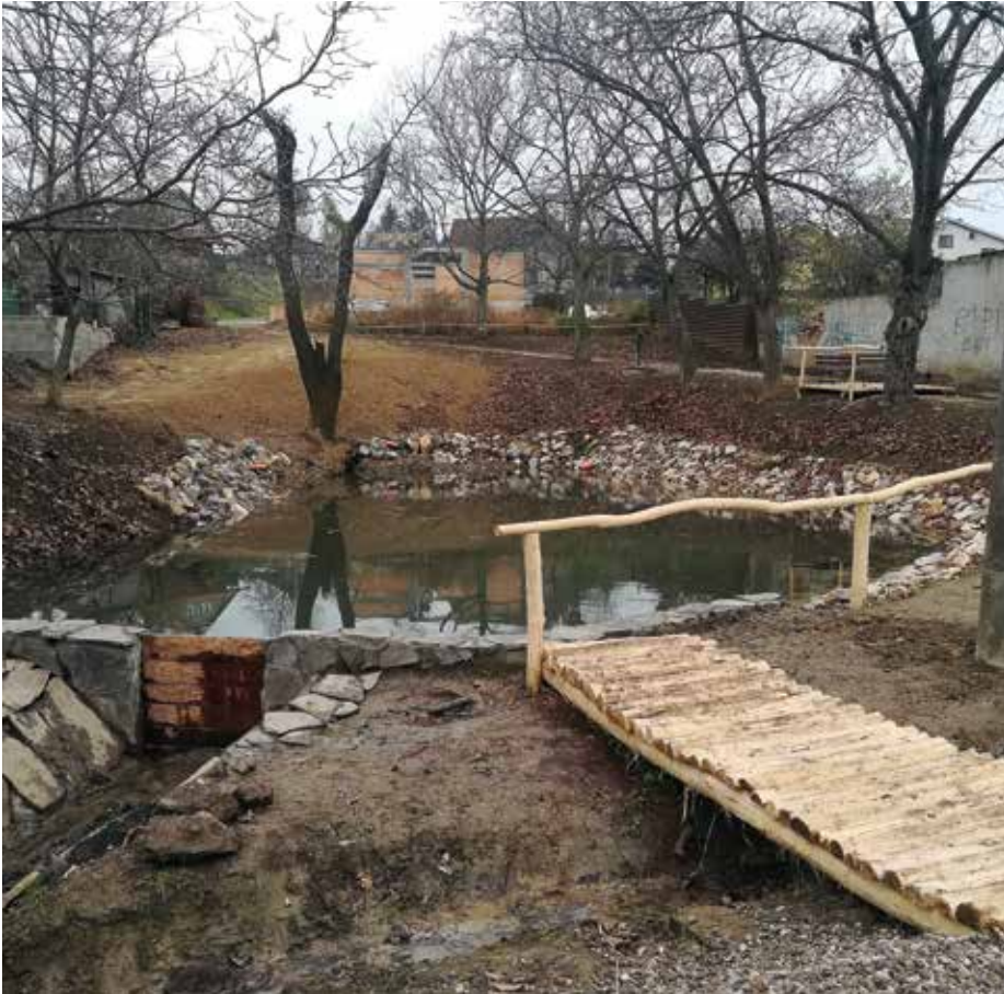
Prvá etapa obnovy jazierka na Sliváši

Momentálne sa nachádzame vo finálnom štádiu s prácami na kanalizácii na Hasičskej ulici, kde bude napojených približne 10 domov. Musím však podotknúť, že tento projekt si občania napojení na kanalizáciu s obcou spolufinancujú.