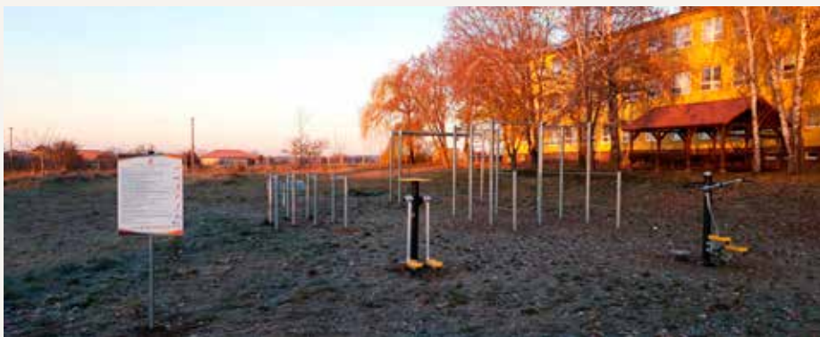
Dobudovaná streetworkoutová zóna v južnej časti areálu Základnej školy v Jarku

V súvislosti s rozsiahlymi zemnými prácami spojenými s vybudovaním spomenutých nových športovísk boli ešte v areáli realizované aj terénne úpravy a záhradnícke práce, pri ktorých bol dobudovaný ochranný pôdny val a zasiaty trávnik v severnej časti školského areálu, dosadené stromy, ktoré sa po predchádzajúcej výsadbe neujali a pokračovalo sa vo vyrovnávaní terás v južnej časti školského areálu. V letných mesiacoch sme však nemysleli len na skvalitnenie a rozširovanie športovísk v areáli školy, ale aj na zvýšenie bezpečnosti detí a rodičov prichádzajúcich do areálu základnej školy a skvalitnenie pracovného prostredia pre jej zamestnancov. Preto bola významne rozšírená parkovacia zóna pri vstupe do školského areálu a v súčasnosti vo svojej dĺžke približne 40 metrov umožňuje bezpečné parkovanie pre až 16 áut, čo je kapacita dostatočná pre zvládnutie ranného a poobedňajšieho náporu dopravy na Školskej ulici. Dúfame preto, že už teraz všet-