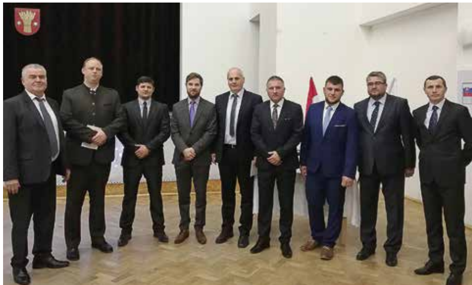
Novozvolení poslanci obecného zastupiteľstva

Za ďalší úspešne zvládnutý projekt považujeme aj „Obnovu jazierka na Sliváši – prvá etapa“. Niektorí spoluobčania využívali toto priestranstvo ako smetisko, museli sme vybagrovať okolo 300 m 3 rôznej suty a nakoľko sa nám severný svah zosúval, museli sme ho spevniť lomovým