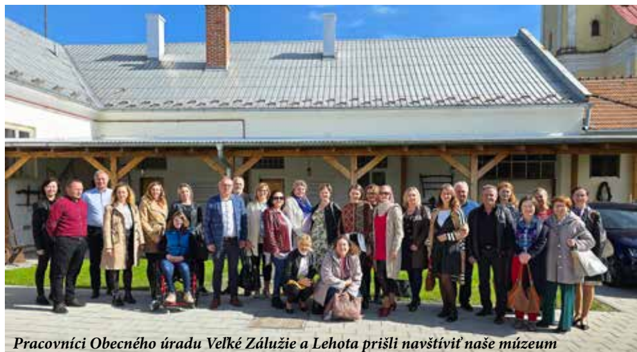
Pracovníci Obecného úradu Veľké Zálužie a Lehota prišli navštíviť naše múzeum

A teraz mi vážení spoluobčania dovoľte, aby som osobitne venoval pozornosť v týchto dňoch veľmi aktuálnej téme a tou je