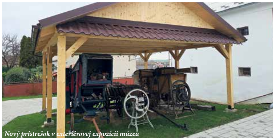
Nový prístrešok v exteriérovej expozícii múzea

Som veľmi rád, že myšlienka komunitného centra na Starej fare, ktoré bude k dispozícii širokému okruhu občanov a návštevníkov, sa stáva každým rokom viac a viac zmysluplnou realitou. Naše obecné múzeum sa teší veľkej obľube a okrem našich školákov a obyvateľov obce ho stále častejšie vyhľadávajú aj návštevníci regiónu z blízkeho i vzdialenejšieho okolia. Obdiv a uznanie nám po jeho prehliadke vyslovili aj pracovníci Obecných úradov zo susedných obcí Močenok, Lehota a Veľké Zálužie. V exteriérovej expozícii sedliackeho dvora sme zrealizovali prístrešok pre historickú mláčačku a ďalšie exponáty, ktoré si vyžadujú primeranú ochranu pred nepriaznivými poveternostnými vplyvmi. V samotnej budove sme vybudovali druhé sociálne zariadenia, ktoré sú k dispozícii najmä členom FS Jaročan a FS Íreckí seniori, ktorí sa tu pravidelne stretávajú a užívajú priestory v rámci svojej záujmovo – umeleckej činnosti. Veľká spoločenská miestnosť pravidelne slúži ako miesto stretávania i rodinných osláv všetkým občanom obce,