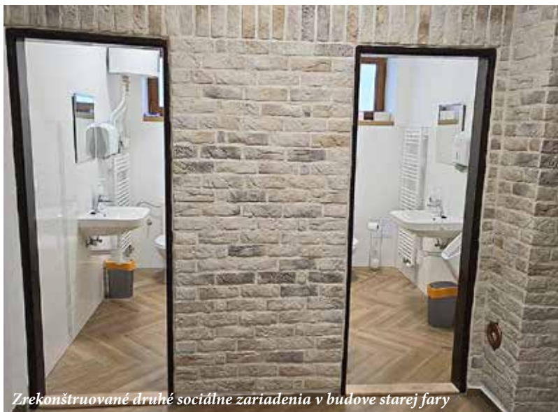
Zrekonštruované druhé sociálne zariadenia v budove starej fary

nakladanie so zmesovým komunálnym odpadom. V úzkej súčinnosti s Ponitrianskym združením obcí intenzívne hľadáme spôsoby a riešenia, ktorými by sme v potrebnej miere dokázali eliminovať problém už v jeho zárodku. Náklady na odvoz a likvidáciu zmesového komunálneho odpadu každým rokom stúpajú a s nástupom zákonnej povinnosti na jeho mechanické do triedovanie a biologickú neutralizáciu narastú poplatky v budúcnosti skokovo, preto je nevyhnutné sústrediť všetky naše sily na to, aby sme v čo najväčšej miere obmedzili jeho produkciu. Separujme svedomito, využívajme kompostéry a kapacitu našej bio-skládky, naozaj je to len o tom, aby sme si vstúpili do svedomia a urobili maximum preto, aby sme svojim potomkom neza-